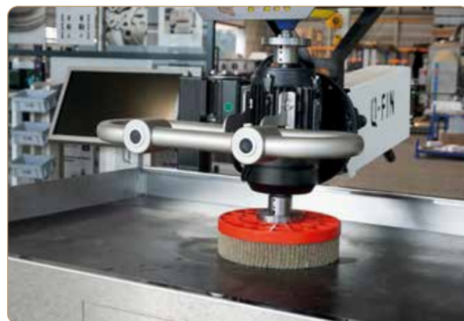
ProGrinder: Kantenverrunden mit der optionaler Tellerbürste.

Die Abmessungen der Arbeitsfläche sind 1280 x 780 mm. Die maximale Tiefe für ein Arbeitsstück beträgt somit 780 mm. Die Länge ist dabei uneingeschränkt, und breitere Produkte sind ebenfalls möglich da die Seiten und Vorderseite vom Tisch einfach umgelegt werden können.